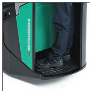
Большая подвесная платформа оператора