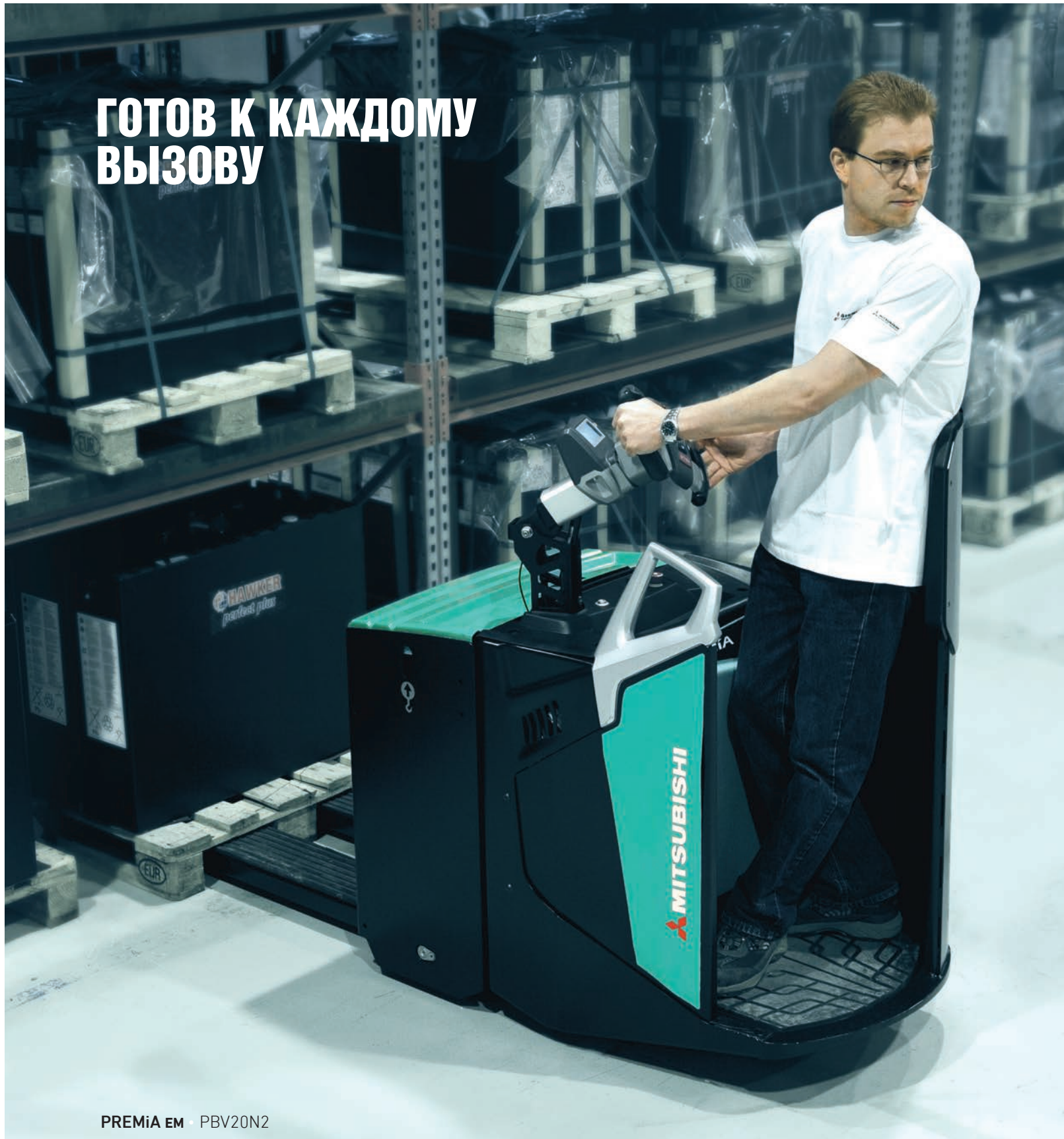
PREMiA EM • PBV20N2