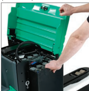
Универсальный аккумуляторный отсек с бесшарнирной крышкой

Разработанные для непрерывной работы в самых сложных условиях, PREMIA ES – сопровождаемые перевозчики паллет, которые помогут вам преодолеть расстояние.