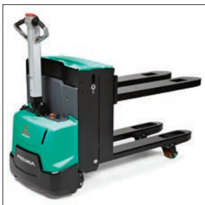
Подъемные вилы (PBP20N2E)