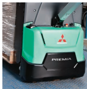
Водонепроницаемое и пылезащищенное шасси