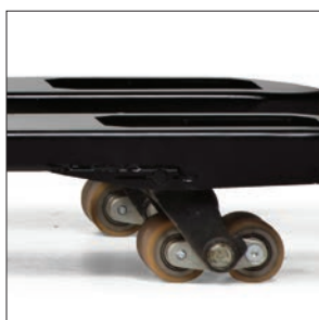
Пылезащищенные грузовые колеса