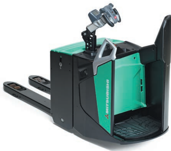
PREMIA ES • PBF25N2