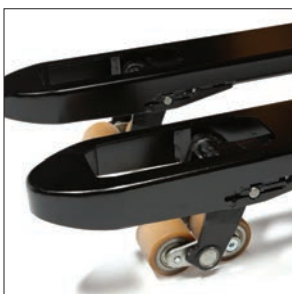
Ведущая на рынке высота подъема