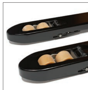
Прочные зауженные вилы