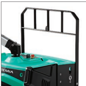
Защитная решетка груза (опция)

Сопровождаемые и двойные перевозчики паллет 2.0 – 2.5 тонны