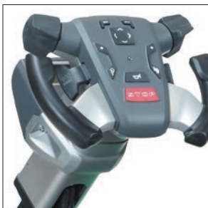
Рулевое колесо Maxius

PREMIA EM платформенные перевозчики паллет созданы для самых сложных условий работы.