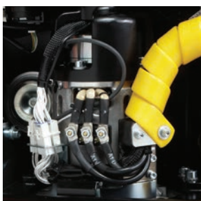
Литой силовой агрегат