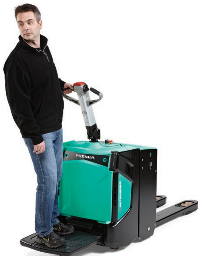
PREMIA ES • PBP20N2R