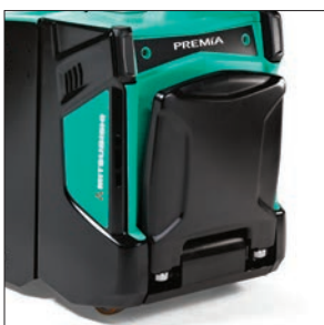
Складная платформа оператора (PBP20N2R)