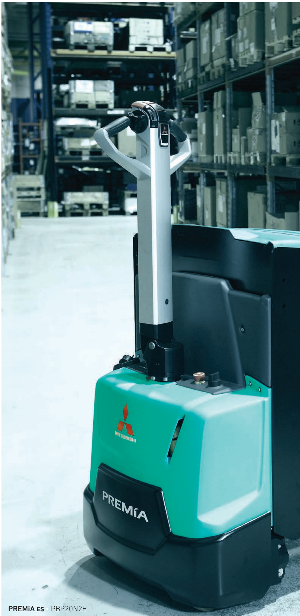
PREMiA ES · PBP20N2E

Продуманный дизайн и умные технологии позволяют отработать рабочую смену без стресса и с максимальной продуктивностью.