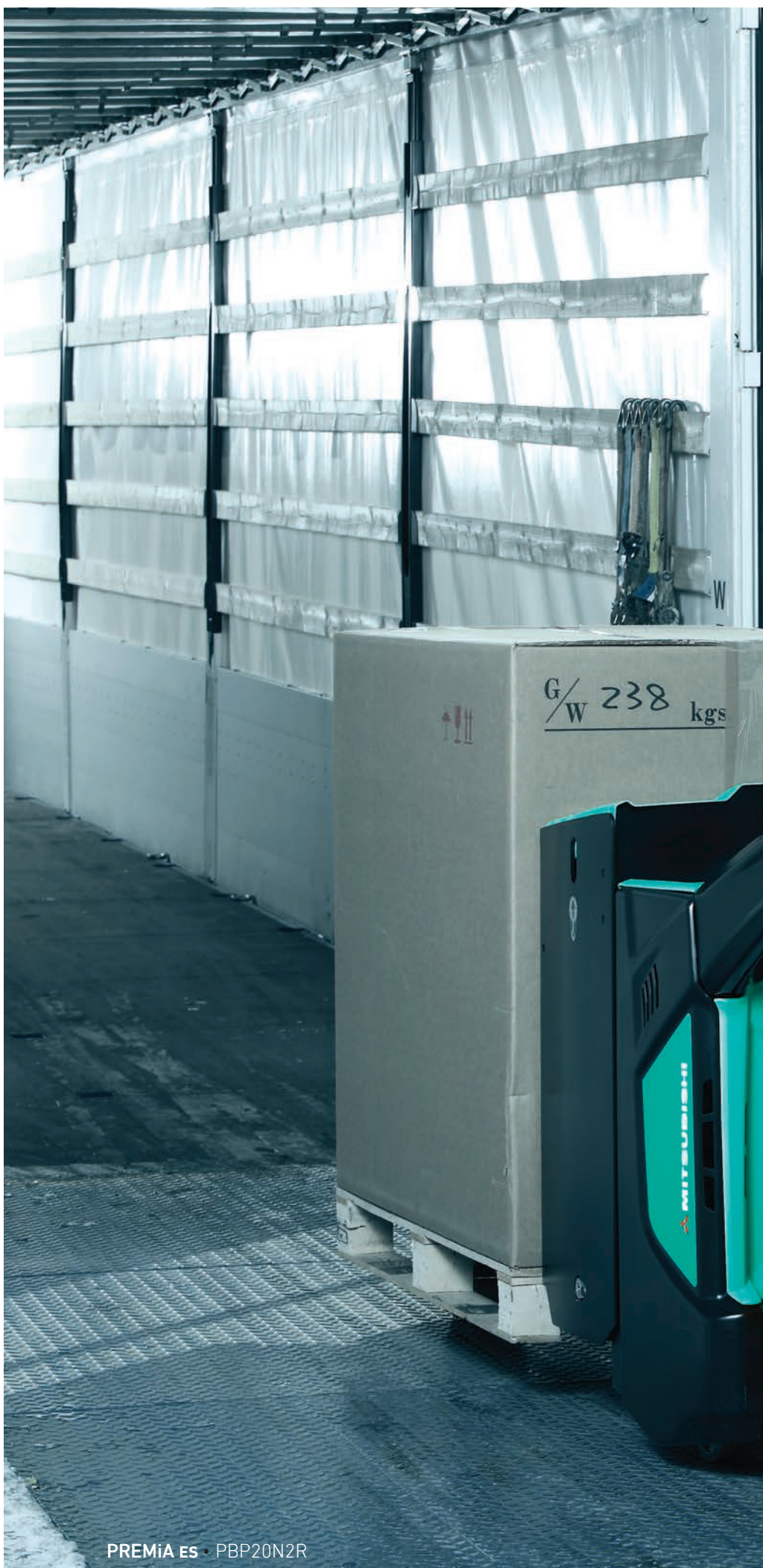
PREMIA ES · PBP20N2R

Операторы любят PREMIA, и вы тоже полюбите.