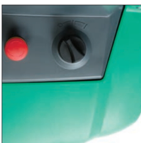
Выбор режима производительности