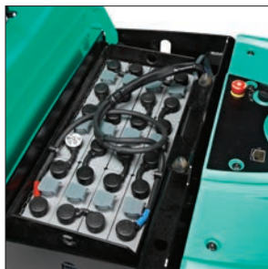
Аккумуляторы большой емкости