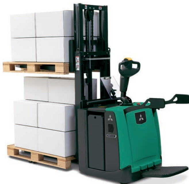
PREMIA EM • PBV20PD