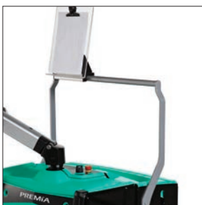
Уникальная конструкция перекладки