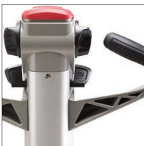
Современная рукоятка управления

Сопровождаемые и двойные перевозчики паллет 1.6 - 2.0 тонны