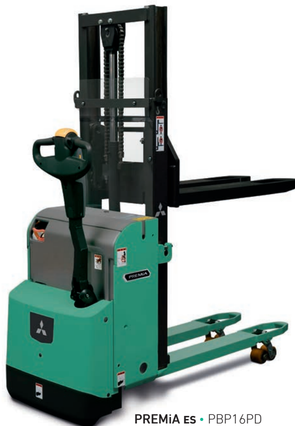
PREMIA ES • PBP16PD