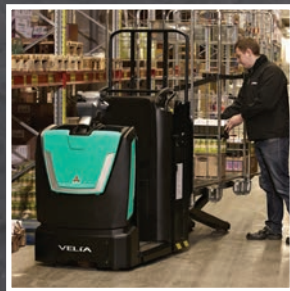
VELIA ES Серия OPB12-20N2