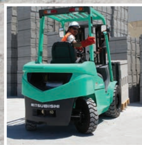
GRENDIA ES Серия FD15-35NT

Поэтому вы получаете погрузчик более производительный и выгодный для вашего бизнеса. Более экономичный в эксплуатации и обслуживании. Более экологичный. Более эффективный и приятный в работе для ваших водителей.