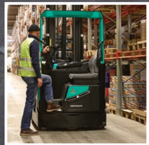
SENSIA EM Серия RB14-25N2