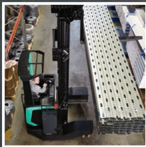
SENSIA EX Серия RBM20-25N2