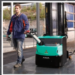
AXIA ES Серия SBP10-16N2/PC