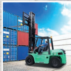
TREXiA ES Серия FD70-100NH