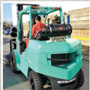
GRENDiA EX Серия FD40-55NT