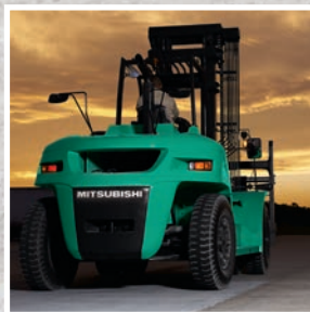
TREXiA EX Серия FD100-150NM