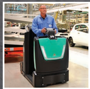
VANTIA Серия TBR30-50N2

Имея ассортимент, включающий более 150 различных моделей, каждая из которых может иметь множество опций, в Mitsubishi уверены, что смогут предложить машину, точно отвечающую вашим потребностям.