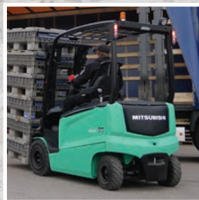
EDiA EX Серия FB25-25N